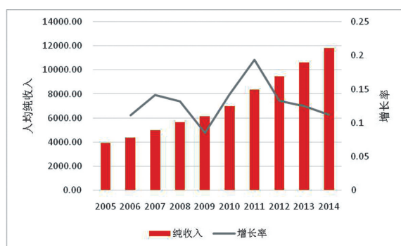
图2 2005-2014年山东省农村住户人均纯收入及增长率 资料来源:根据《山东统计年鉴》(2005-2014年)整理所得

可以看出,山东省农民人均纯收入总体上几乎呈现直线上升趋势,但增长率的变化浮动较大。2008年前后受金融危机的影响,增长率出现明显下滑,近几年的增长率也随GDP增长的减缓而放慢。(如图2)