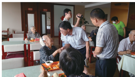
图1 2016年9月7日,在威海东发老年公寓与入住老人交谈。

2016年8月19日至10月15日,山东社会科学院人口所“山东省养老机构发展瓶颈及其破解”课题组联合省老年产业协会,在我和白玉光会长带领下,历时56天,行程万余里,先后赴全省17个市,通过问卷调查、座谈、个人访谈等方式,对17市近50个县市区的80余家公办、民办、公建民营等不同类型养老机构和城市社区日间照料中心、农村社区幸福院的投资和收支状况、床位和入住情况、政策补贴情况、老年人能力评估、人员管理、老年人需求等问题进行了详细的了解,并重点关注了医养结合、养老服务人才队伍建设、养老服务标准化及养老机构服务质量评估等问题,为破解山东省养老机构所面临的发展困境收集了大量详实的一手资料。由同一批人马就同一问题在全省进行如此大规模普遍调研,在我院甚至我省历史上还不多见。近两个月的忙碌,逾万里的奔波,其中的酸甜苦辣,点点滴滴,至今仍记忆犹新,历历在目,追忆起来,更是别有一番滋味在心头。