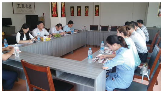
图2 2016年9月9日,在淄博张店区夕阳红老年公寓座谈。

由于经费和人力有限,我们起初打算做典型调查,在全省找几家有代表性的养老机构,再结合现有的面上数据进行分析,就可以搞出一篇研究报告。但是,我很快就发现,这种典型调查的代表性很不充分,根本无法说明问题。于是决定集全所之力,对全省17个市进行普遍调查,每个市至少选3家养老机构进行问卷调查,辅之以座谈和个人访谈。3家养老机构中,公办、民办、公建民营各一个,同时要兼顾不同规模、不同收费档次、不同经营情况、不同地理位置等。这样一来,虽然工作量大大增加,研究周期大大延长,但我相信,将来的调查结论会更切合实际,更具有针对性和说服力。