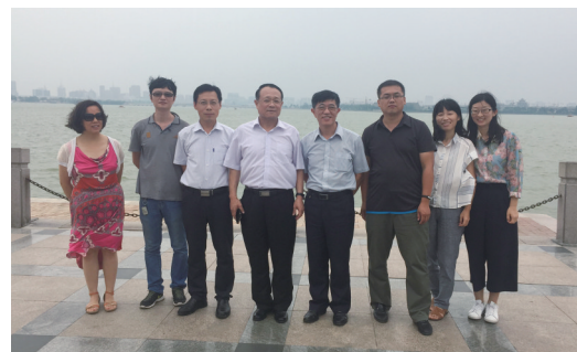
图5 2016年8月20日,调研组途经聊城东昌湖时匆匆留影。