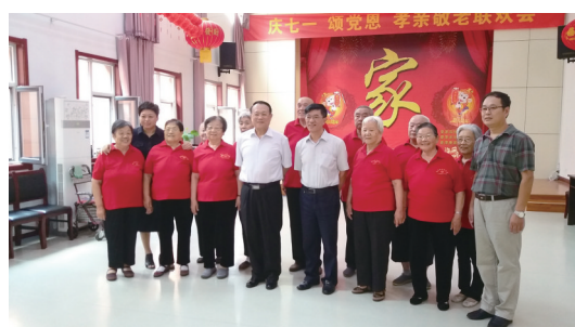
图4 2016年8月21日,在平原县养老服务中心与老人一起联欢。

上午九点半,车子平稳地停在了泰安泰山慈恩医养中心门口。我们为为期近两个月的漫长的调研,便这样在滂沱大雨中拉开了帷幕。